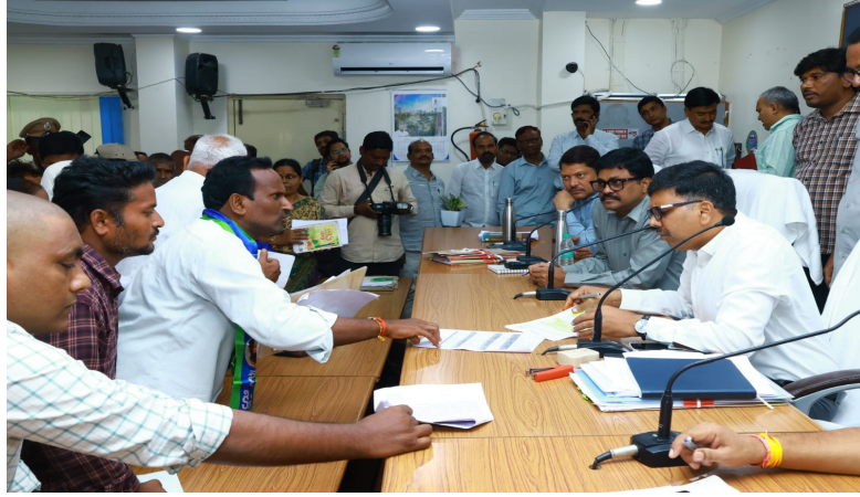
నల్లగొండ నేషనలిస్ట్ వాయిస్ ప్రతినిధి