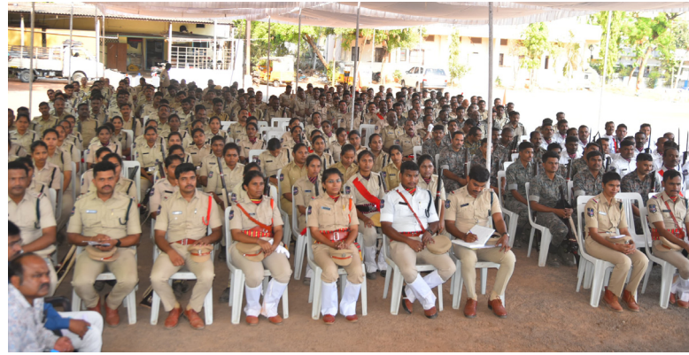
ఉమ్మడి వరంగల్ జిల్లా స్టాప్ లిపోర్టర్ జూన్