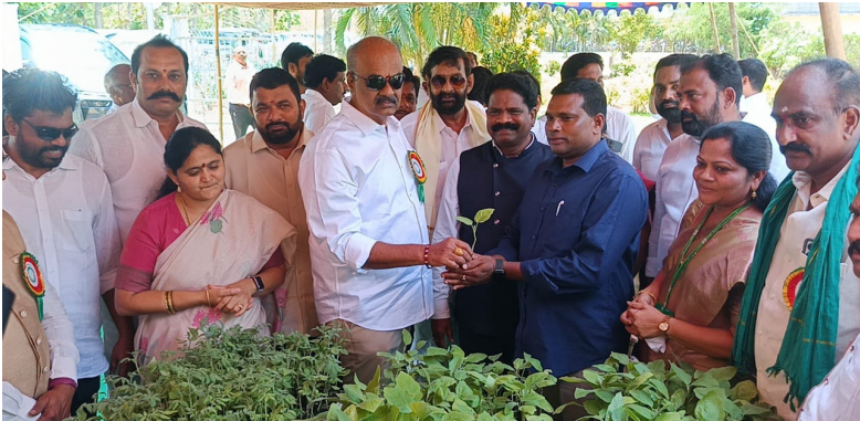
తాడేపల్లిగూడెం ప్రతినిధి జూన్ 5

అందించుకోవాలి రైతులు వ్యవసాయాన్ని లాభసాటిగా మార్చుకోవాలని సూచించారు. ఉద్యాన విశ్వవిద్యాలయంలో రైతుల ఉన్నత కోసమే ఈ రైతు సదస్సు నిర్వహిస్తున్నామని తెలిపారు. ముఖ్యమంత్రి చంద్రబాబు నాయుడు, ఉప ముఖ్యమంత్రి పవన్ కళ్యాణ్ సారధ్యంలో కూటమి ప్రభుత్వం రైతుల సంక్షేమమే ధ్యేయంగా పనిచేస్తుందని చెప్పారు. గత వైసీపీ ప్రభుత్వ హయాంలో రైతులు అనేక అవస్థలు పడ్డారని, కూటమి ప్రభుత్వం వచ్చిన వెంటనే రైతుల సమస్యలు అన్నింటినీ పరిష్కరించినట్లు తెలిపారు. రైతుల సంక్షేమమే దేశానికి కీలకమనే విశ్వాసంతో ప్రభుత్వం ప్రభుత్వం అభివృద్ధిని గాలికి వదిలేసిందన్నారు. రైతులను, ఎస్సీ, బీసీ, తదితర అన్ని వర్గాల ప్రజలను మోసంచేసి ఇప్పుడు వెన్నుపోటు