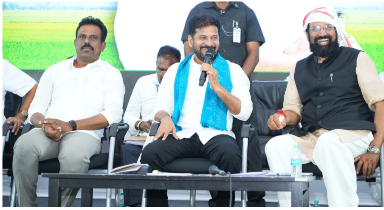
దేవరకర్ణ జూన్ 5 నేషనలిస్ట్ వాయిస్