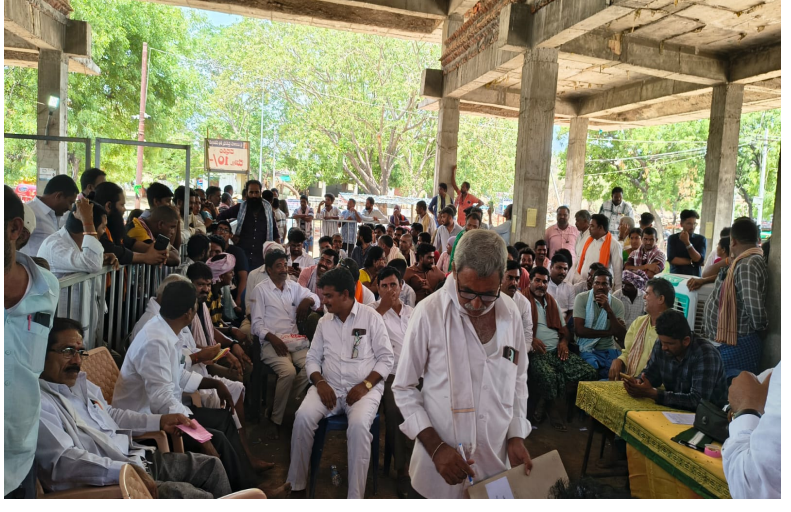
దామరచర్ల నేషనలిస్ట్ వాయిస్ ప్రతినిధి జూన్ 5.