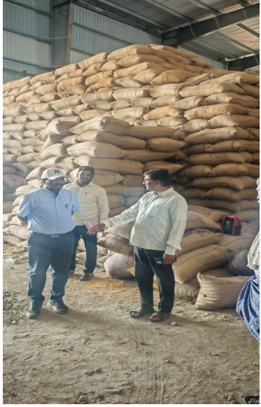
తెలిపారు. ఈ కార్యక్రమంలో సంబంధిత అధికారులు తదితరులు పాల్గొన్నారు.

మిల్లులు, గోదామలకు తరలించడం జరుగుతుందని, ఈ క్రమంలో రైస్ మిల్లులు, గోదామలకు తరలించబడి లారీలలో వేచి చూస్తున్న ధాన్యం దిగుమతి ప్రక్రియ వేగవంతం చేయాలని గోదాం నిర్వాహకులకు సూచించారు. రైస్ మిల్లులు, గోదామలకు తరలించబడిన ధాన్యం దిగుమతి ప్రక్రియను వేగవంతం చేయాలని, రోజుకి కనీసం 50 లారీల నుంచి ధాన్యం దిగుమతి చేయాలని తెలిపారు. ధాన్యం దిగుమతికి సరిపడా హమాళిలను సమకూర్చడం జరిగిందని, ధాన్యం దిగుమతి ప్రక్రియ త్వరితగతిన పూర్తయ్యేలా చర్యలు తీసుకోవాలని తెలిపారు. ఈ కార్యక్రమంలో సంబంధిత అధికారులు తదితరులు పాల్గొన్నారు.