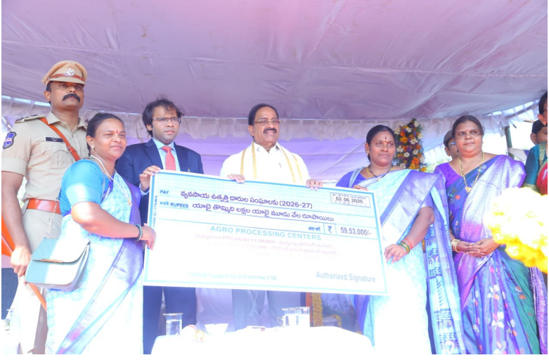
భద్రాద్రి కొత్తగూడెం, జూన్ 02 (నేషనలిస్ట్ వాయిస్):

-రాష్ట్ర వ్యవసాయ శాఖ మంత్రి తుమ్మల నాగేశ్వరరావు-ప్రగతి మైదానంలో ఘనంగా తెలంగాణ రాష్ట్ర ఆవిర్భావ దినోత్సవ వేడుకలు