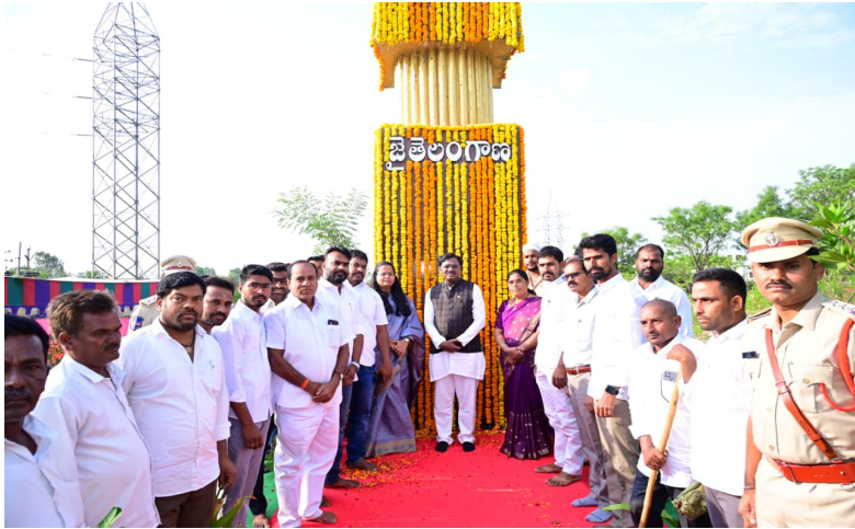
చిన్న శంకరంపేట జూన్ 2, (నేషనల్స్ వాయిస్ ప్రతినిధి)

తెలంగాణ రాష్ట్రం ఏర్పాటు మంత్రి గడ్డం వివేక్ వెంకటస్వామి