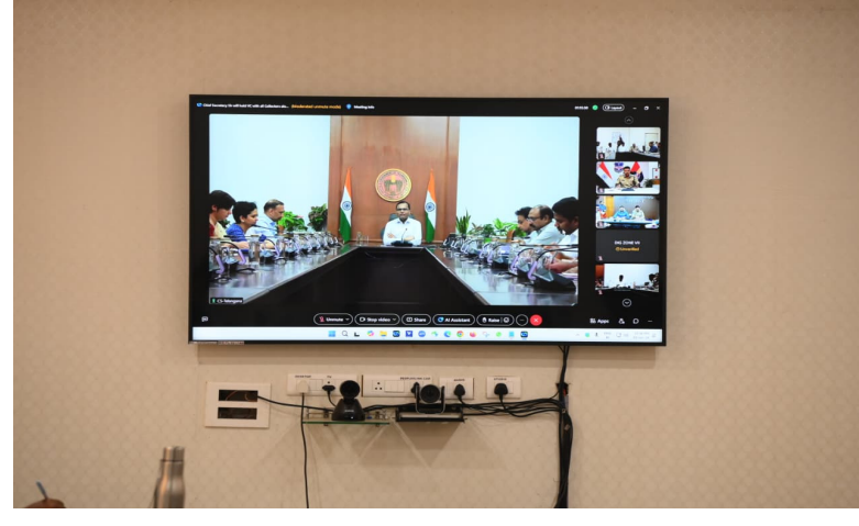
మంచీర్యాల జిల్లా ప్రతినిధి, జూన్ 02 (నేషనలిస్ట్ వాయిస్):

ప్రజా పాలన - ప్రగతి ప్రణాళిక 99 రోజుల కార్యచరణలో భాగంగా జూన్ 4, 6, 8, 10 తేదీలలో రాష్ట్రంలోని అన్ని గ్రామపంచాయతీలలో గ్రామసభలు, మున్సిపల్ కార్పొరేషన్లు, మున్సిపాలిటీలలో డివిజన్, వార్డు సభలు సమర్థవంతంగా నిర్వహించాలని ప్రభుత్వ ప్రధాన కార్యదర్శి రామకృష్ణారావు తెలిపారు. మంగళవారం హైదరాబాద్ నుండి రాష్ట్ర డి.జి.పి సి.పి ఆనంద్, ఇతర ఉన్నతాధికారులతో కలిసి వీడియో కాన్ఫరెన్స్ ద్వారా అన్ని జిల్లాల కలెక్టర్లు, అదనపు కలెక్టర్లు, పోలీసు ఉన్నతాధికారులు, సంబంధిత శాఖల అధికారులతో సభల నిర్వహణపై సమీక్ష నిర్వహించారు. ఈ సందర్భంగా రాష్ట్ర ప్రభుత్వ ప్రధాన కార్యదర్శి రామకృష్ణారావు మాట్లాడుతూ, 99 రోజుల కార్యచరణలో భాగంగా జూన్ 4, 6, 8, 10 తేదీలలో గ్రామపంచాయతీలలో, మున్సిపల్ కార్పొరేషన్లు, మున్సిపాలిటీలలో డివిజన్, వార్డులలో నిర్వహించనున్న సభలకు సంబంధిత శాఖల అధికారులు తప్పనిసరిగా హాజరు కావాలని తెలిపారు. సభలలో కేంద్ర ఎన్నికల