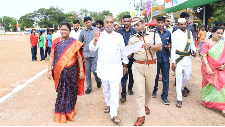
(సంగారెడ్డి జిల్లా నేషనలిస్ వాయిస్ మే 2 )