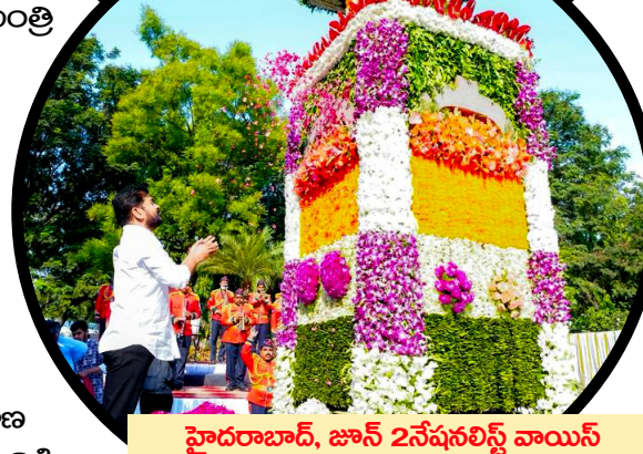
హైదరాబాద్, జూన్ 2 నేషనలిస్టు వాయిస్ తెలంగాణ అవతరణ దినోత్సవం సందర్భంగా నిరుద్యోగ యువతకు సీఎం రేవంత్ రెడ్డి గుడ్ న్యూస్ చెప్పారు. త్వరలోనే పలు జాబ్ నోటిఫికేషన్లను టీజీపీఎస్సీ విడుదల చేస్తుందని తెలిపారు. మగతా 2లో