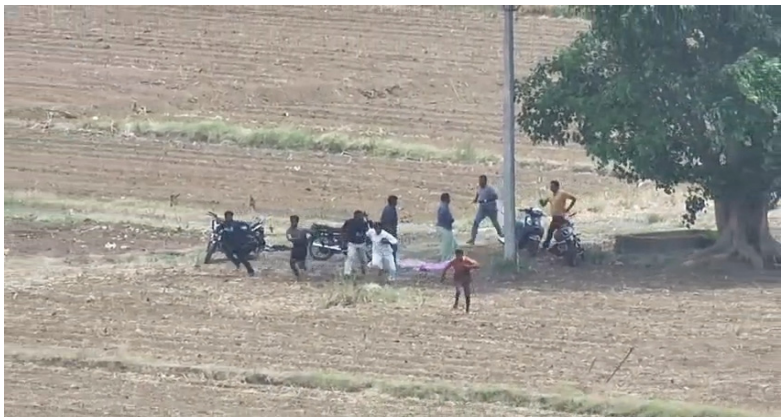
జంగారెడ్డిగూడెం, మే 29: (నేషనలిస్ట్ వాయిస్)

- పేకాట రాయుళ్ల అటకట్టించిన జంగారెడ్డిగూడెం పోలీసులు!