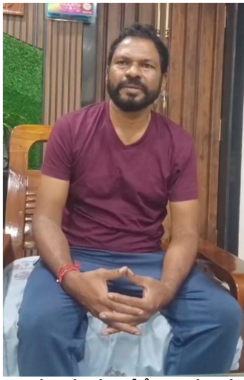
జడ్జి తో గానీ లేదా సీబీఐ తో గానీ నిష్పాక్షిక విచారణ జరిపించాలి. అలాగే అక్రమాలకు పాల్పడిన దోషులను కఠినంగా శిక్షించి, నష్టపోయిన నిరుద్యోగులకు తక్షణమే న్యాయం చేయాలి.