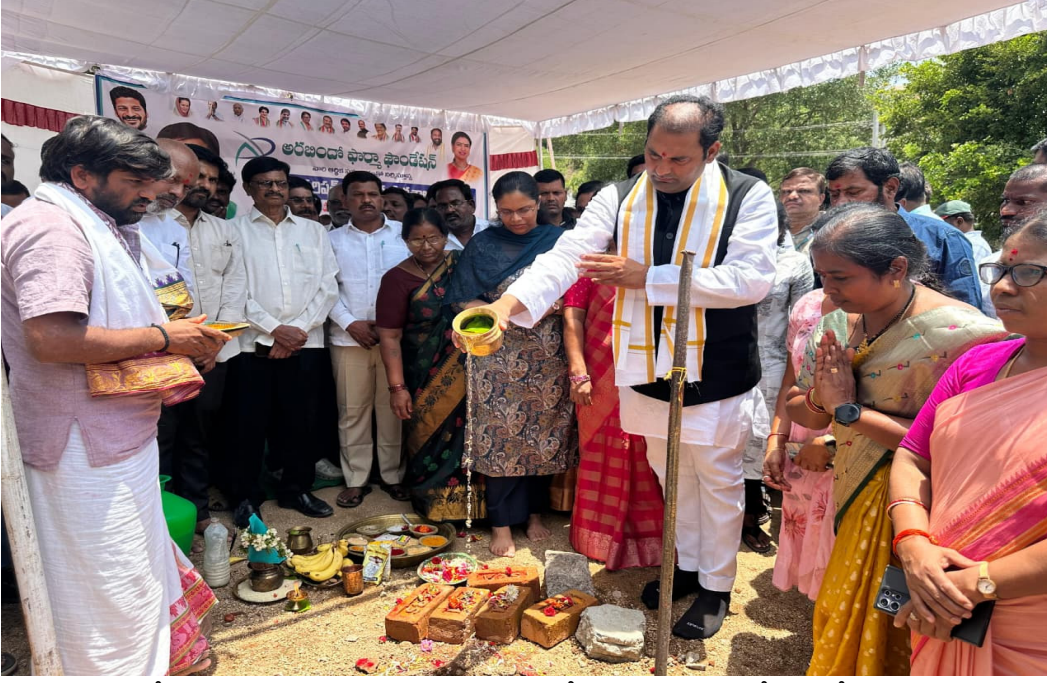
విద్యాభివృద్ధి కోసం ప్రభుత్వం, స్వచ్ఛంద సంస్థల సమన్వయంతో పనిచేస్తున్నాయని అన్నారు. హరిజనవాడలో నిర్మించనున్న ఈ నూతన పాఠశాల భవనం విద్యార్థులకు ఎంతో ఉపయోగపడుతుందని, భవిష్యత్తులో మరిన్ని అభివృద్ధి కార్యక్రమాలను చేపడతామని ఎమ్మెల్యే హామీ ఇచ్చారు. ఈ కార్యక్రమంలో స్థానిక ప్రజాప్రతినిధులు, అధికారులు, అరబిందో ఫార్మా ప్రతినిధులు, పార్టీ నాయకులు, కార్యకర్తలు మరియు స్థానిక ప్రజలు పాల్గొన్నారు.