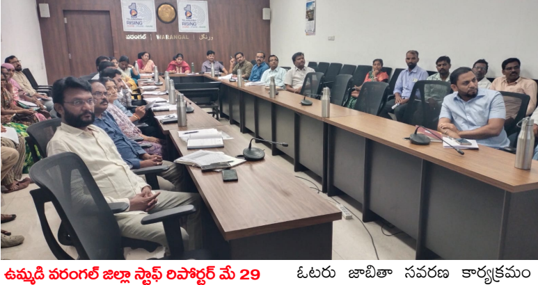
ఉమ్మడి వరంగల్ జిల్లా స్టాఫ్ రిపోర్టర్ మే 29 (నేషనలిస్ట్ వాయిస్ న్యూస్)

ఎస్ఐఆర్ మ్యూపింగ్ ప్రక్రియపై రాష్ట్రంలోని అన్ని జిల్లాల కలెక్టర్లతో వీడియో కాన్ఫరెన్స్ ద్వారా సమీక్ష నిర్వహించిన రాష్ట్ర ప్రధాన ఎన్నికల అధికారి