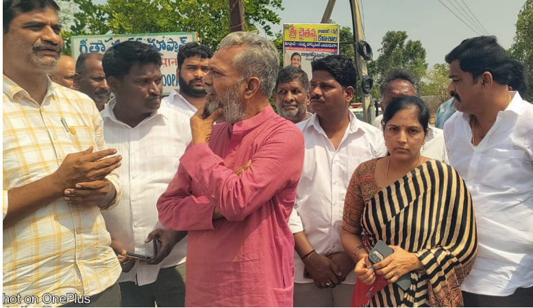
తూప్రాన్, మే 29. నేషనలిస్ట్ వాయిస్ ప్రతినిధి:

-ధాన్యం తరలింపుకు ప్రత్యేక చర్యలు - లారీల మళ్లింపు -రైతులు ఆందోళన చెందొద్దు : గజ్వేల్ మాజీ ఎమ్మెల్యే తూముకుంట నర్సారెడ్డి