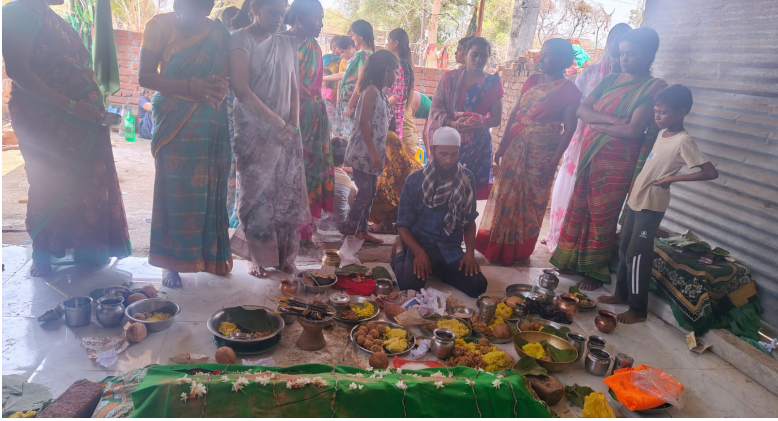
అదిలాబాద్ జిల్లా మే 29 (నేషనలిస్ట్ వాయిస్)

అదిలాబాద్ జిల్లా హతూర్ మండలం లోని వర్తమాన్సూర్ గ్రామంలో బాబా మాలిక్ సబ్ దస్తగిరి బాబా దేవాలయంలో నిర్వహించే మలీదా ఉత్సవం గత 65 సంవత్సరాలుగా భక్తి శ్రద్ధలతో కొనసాగుతోంది. గ్రామ ప్రజల ఆధ్యాత్మిక విశ్వాసానికి ప్రతీకగా నిలిచిన ఈ ఉత్సవం ప్రతి ఏడాది ఘనంగా నిర్వహించబడుతోంది. గ్రామ పెద్దల కథనం ప్రకారం, గతంలో గ్రామంలో వర్షాభావ