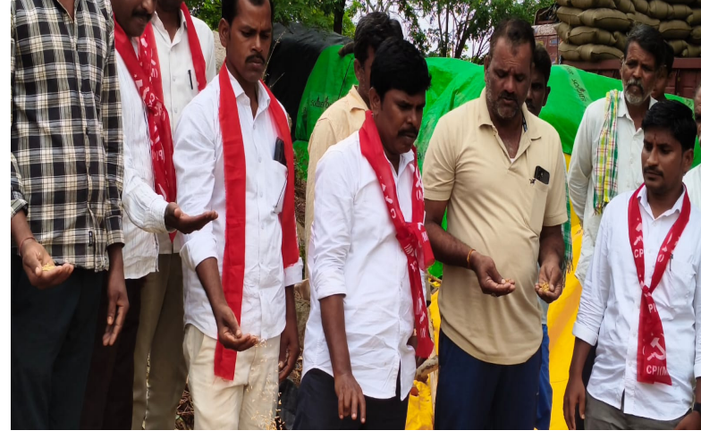
దోమ నేషనలిస్ట్ వాయిస్ ప్రతినది మే 27