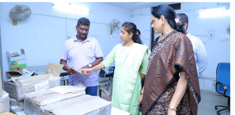
ఉమ్మడి వరంగల్ జిల్లా స్టాఫ్ రిపోర్టర్ మే 23 (నేషనలిస్ట్ వాయిస్ న్యూస్)