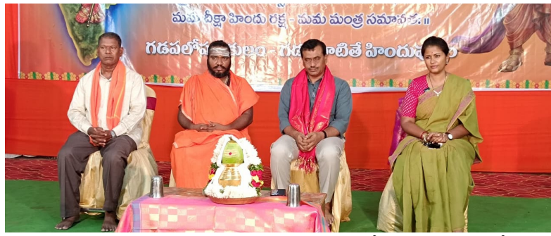
దేవరకర్త మే 23 నేషనల్స్ వాయిస్