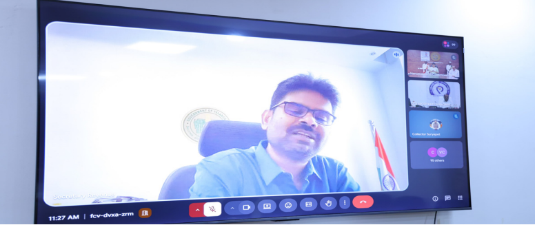
ఉమ్మడి వరంగల్ జిల్లా స్టాఫ్ రిపోర్టర్ మే 23 (నేషనలిస్ట్ వాయిస్ న్యూస్)