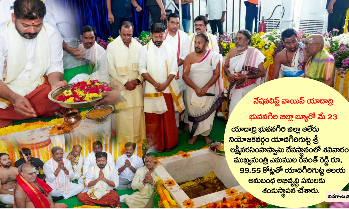
నేషనలిస్టు వాయిస్ యాదాద్రి భువనగిరి జిల్లా బ్యూరో మే 23 యాదాద్రి భువనగిరి జిల్లా ఆలేరు నియోజకవర్గం యాదగిరిగుట్ట శ్రీ లక్ష్మీనరసింహస్వామి దేవస్థానంలో శనివారం ముఖ్యమంత్రి ఎనుముల రేవంత్ రెడ్డి రూ. 99.55 కోట్లతో యాదగిరిగుట్ట ఆలయ అనుబంధ అభివృద్ధి పనులకు శంకుస్థాపన చేశారు.

ప్రచురణ: తెలంగాణ, ఆంధ్రప్రదేశ్ సంపుటి : 01 సంచిక : 176 24 ఆదివారం, మే 2026 వేజీలు : 12 వెల: రూ. 3/- హైదరాబాద్, నిజామాబాద్, వరంగల్, కరీంనగర్, రంగారెడ్డి, ఆదిలాబాద్, మెదక్, నల్గొండ, మహబూబ్ నగర్, ఖమ్మం, విజయవాడ, గుంటూరు, అమరావతి, క్రీష్ణ, గోదావరి, కర్నూలు, చిత్తూరు, కడప, ప్రకాశం, శ్రీకాకుళం