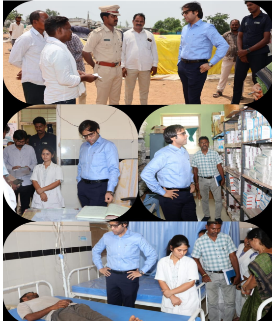
కలగకుండా నాణ్యమైన వైద్య సేవలు అందించాలని తెలిపారు. ప్రాథమిక ఆరోగ్య కేంద్రాల్లో వైద్యులు సిబ్బంది తప్పనిసరిగా అందుబాటులో ఉండాలని సమయపాటు పాటిస్తూ బాధ్యతాయుతంగా విధులు నిర్వహించాలని జిల్లా కలెక్టర్ ఆదేశించారు. ప్రజలకు మెరుగైన వైద్య సేవలు అందించడం ప్రతి ఒక్కరి బాధ్యత అని అన్నారు. ఈ పరిశీలనలో తహశీల్దార్ ఉపాధికారి, ప్రాథమిక ఆరోగ్య కేంద్రం సిబ్బంది, సంబంధిత శాఖల అధికారులు తదితరులు పాల్గొన్నారు.