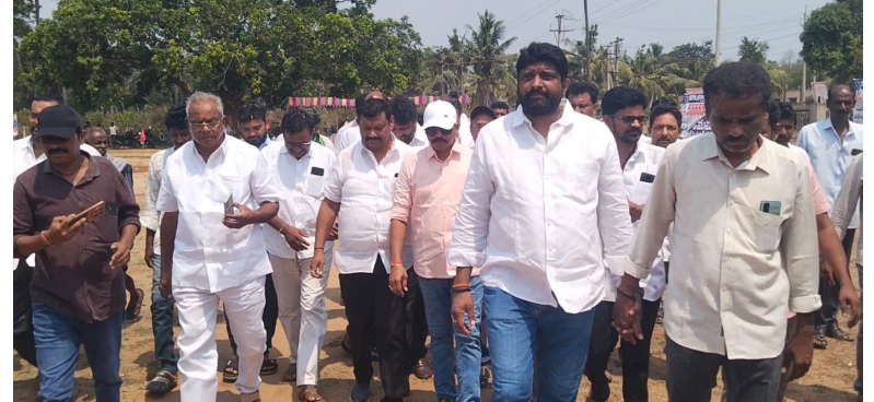
అప్పలరాజుగూడెం 20 (నేషనల్ వాయిస్)

- స్వయంగా బ్యాట్ పట్టి యువతలో ఊష్ నింపిన శాసనసభ్యులు