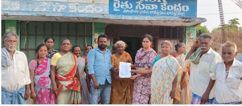
ఇవ్వాలని, ఉపాధి వేతనదారులు ప్రమాదంలో మరణిస్తే 10 లక్షల రూపాయలు ఎక్సీసీయూ ఇవ్వాలని, కుటుంబానికి 200 రోజులు పని కల్పించాలని, రోజుకి వేతనం రూ. 700 లు ఇవ్వాలని, అవినీతిని అరికట్టాలని, ఉపాధి హామీ కూలీలు పాల్గొన్నారు.

రెండు పూటల ఫేస్ యాప్ ఫోటోల పద్ధతి తీసుకురావడం ద్వారా అనేక చోట్ల పనిచేసినప్పటికీ సరైన సమయంలో ఫోటోలు అప్లోడ్ కాక వ్యవసాయ కూలీలు తీవ్రమైన ఇబ్బందులు పడుతున్నారని తెలిపారు. అందువల్ల తక్షణం రెండు పూటల ఫోటో పద్ధతిని రద్దు చేయాలని డిమాండ్ చేశారు. ఉపాధి హామీకి మన రాష్ట్రానికి 10 వేల కోట్ల రూపాయలను కేంద్రం నిధులు కేటాయించాలని, సమ్మర్ అలవెన్స్ కొనసాగించాలని, వేసవి కాలంలో మంచినీళ్లు, మజ్జిగ సౌకర్యం కల్పించాలని, 30 రోజులు పని చేసిన కుటుంబానికి పనిముట్లు, ప్రతి గ్రూప్ కి టెంట్, మెడికల్ కిట్