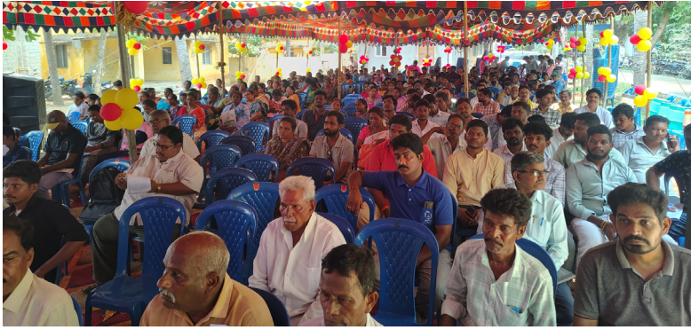
బుట్టాయగూడెం, మే 19 నేషనల్స్ వాయిస్:

- నిర్లక్ష్యం వహిస్తే చర్యలు తప్పవని అధికారులకు హెచ్చరిక