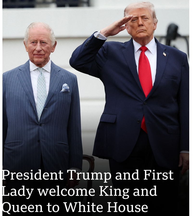
President Trump and First Lady welcome King and Queen to White House

బ్రిటిష్ వారు లేకపోతే అమెరికా ప్రజలు ఫ్రెంచ్ మాట్లాడాల్సి వచ్చేదంటూ బ్రిటన్ రాజు ఛార్లెస్ అమెరికా అధ్యక్షుడు ట్రంప్ ను ఎద్దేవా చేస్తూ చురకలు అంటించారు. మంగళవారం రాత్రి అధ్యక్ష కార్యాలయంలో జరిగిన స్టేట్ డిన్నర్ లో ఆయన సరదాగా మాట్లాడుతూ.. రెండో ప్రపంచ యుద్ధంలో అమెరికా సహాయం చేయకపోతే యూరోపియన్ దేశాల ప్రజలు జర్మన్, జపనీస్ మాట్లాడేవారని ట్రంప్ గతంలో అన్న మాటలను బ్రిటన్ రాజు గుర్తుచేశారు. 'అధ్యక్షా.. అమెరికా లేకపోతే యూరోపియన్ దేశాలు జర్మన్ మాట్లాడేవని మీరు ఇటీవల వ్యాఖ్యానించారు. నేనేం చెబుతున్నానంటే ఒకవేళ మేము లేకపోతే, మీరు ఫ్రెంచ్ మాట్లాడేవారు' అని ఛార్లెస్ చమత్కరించారు. 250 ఏళ్ల క్రితం అమెరికాకు స్వాతంత్ర్యం రాకముందు.. ఈ దేశంపై పట్టు కోసం బ్రిటన్, ఫ్రాన్స్ చేసిన ప్రయత్నం గురించి ఆయన ప్రస్తావించారు. లండన్-వాషింగ్టన్ మధ్య ఉన్న ప్రత్యేక సంబంధాన్ని కొనియాడారు. అనంతరం ట్రంప్ మాట్లాడుతూ.. స్టేట్ డిన్నర్ లో అద్భుతమైన ప్రసంగం చేసినందుకు బ్రిటన్ రాజును అభినందించారు. ఇరాన్ తో యుద్ధం విషయంలో తమకు మద్దతిచ్చేందుకు ఆ దేశ ప్రధాని కీర్ స్టార్బర్ట్ ముందుకు రాకపోవడాన్ని విమర్శించారు.