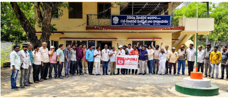
తాడేపల్లిగూడెం ప్రతినిధి ఏప్రిల్ 29