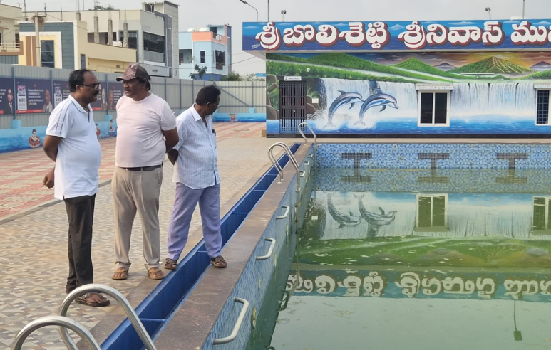
తాడేపల్లిగూడెం ప్రతినిధి ఏప్రిల్ 29 (నేషనలిస్ట్ వాయిస్)