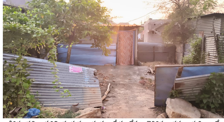
ఇదే గాన ప్రతి ఒక్కరిని సంఘము, సంస్థల పేర్లు చేస్తూ బెదిరిస్తూ వస్తున్నాయి. ఇదే కాకుండా గ్రామం లో అవినీతి పరులకు కొమ్ము కస్తూ పాలనకు అటంకాలు కలిగిస్తూనే ఉంది.