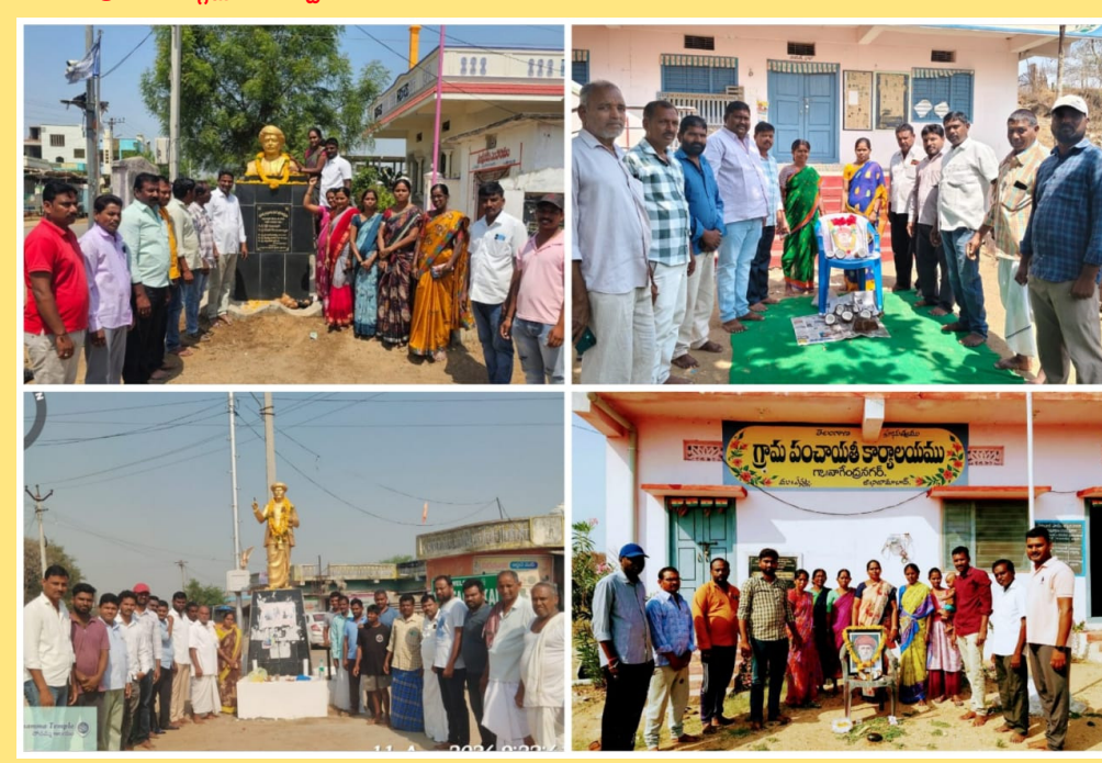
ఘనంగా జ్యోతిబా పూలే జయంతి వేడుకలు నిర్వహించారు.