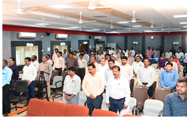
భద్రాద్రి కొత్తగూడెం, ఏప్రిల్ 11 (నేషనలిస్ట్ వాయిస్):

-అందుబాటులో పునరావాస సేవలు -జిల్లా కలెక్టర్ అంకిత్