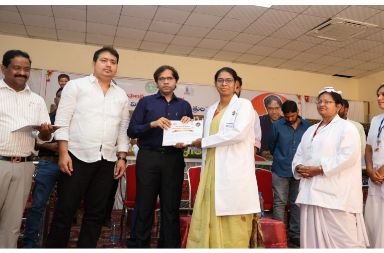
భద్రాద్రి కొత్తగూడెం, ఏప్రిల్ 11, నేషనలిస్ట్ వాయిస్:

-సమన్వయంతోనే జిల్లాకు రాష్ట్రస్థాయి అవార్డులు వైద్య శాఖకు కలెక్టర్ అభినందనలు