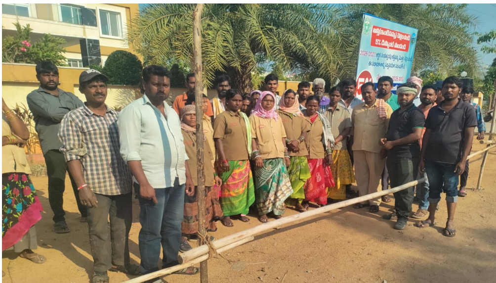
తూప్రాన్ లో సఫాయి కార్మికులు అధికారులను కోరుతున్నారు.