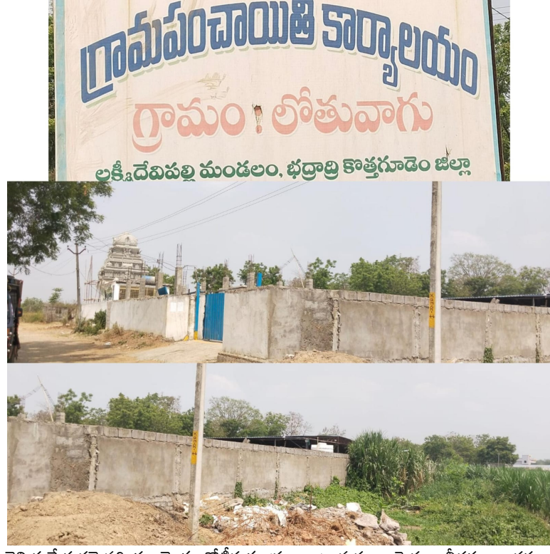
తెలియజేయడమైనది. ఈ యొక్క నోటీసుకు ప్రజలు గ్రామస్థులు పెద్దలు లీడర్లు అందరూ సహకరించగలరు అటవీ చట్టం భూముల విషయాల్లో ఎవరు అడ్డపడ్డ వారు శిక్ష అర్హులు