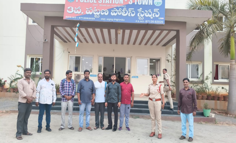
భద్రాద్రి కొత్తగూడెం, ఏప్రిల్ 11, నేషనలిస్ట్ వాయిస్:

అక్రమ అరెస్టులను ఖండించిన భద్రాద్రి కొత్తగూడెం సీఐటీయూ జిల్లా కమిటీ