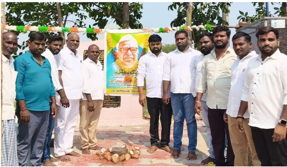
తూప్రాన్, ఏప్రిల్ 5 (నేషనలిస్ట్ వాయిస్ ప్రతినిధి):