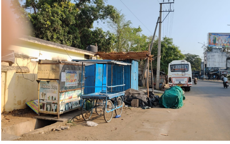
భద్రాద్రి కొత్తగూడెం, ఏప్రిల్ 5(నేషనలిస్ట్ వాయిస్):

కొత్తగూడెం పట్టణంలోని పలు ప్రాంతాలలో వ్యాపారం ముసుగులో కొందరు స్థలాలను ఆక్రమించి దండాను కొనసాగిస్తున్నారు. ముఖ్యంగా పోస్ట్ ఆఫీస్ సెంటర్ నుండి బాబు క్యాంపు క్యాంపు రామాలయం వరకు వ్యాపారం పేరుతో ఆక్రమణలు డబ్బా కొట్టను అమర్చుకొని వాటిని కొందరు అడ్డెక్కిస్తూ దోచుకుంటున్నారు. ఇటీవల కాలంలో పంచాయతీరాజ్ డివిజ్మెంట్ చెందిన ఖాళీ స్థలం పక్కనే డబ్బా కొట్టలను పెట్టుకొని దర్జాగా వ్యాపారాన్ని