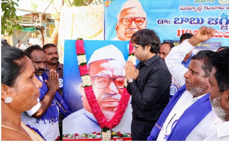
భద్రాద్రి కొత్తగూడెం, ఏప్రిల్ 5(నేషనలిస్ట్ వాయిస్):