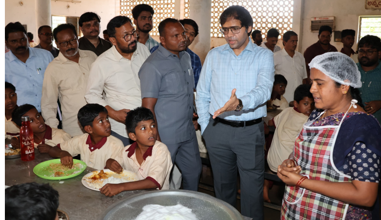
భద్రాద్రి కొత్తగూడెం, ఏప్రిల్ 1 (నేషనలిస్ట్ వాయిస్):