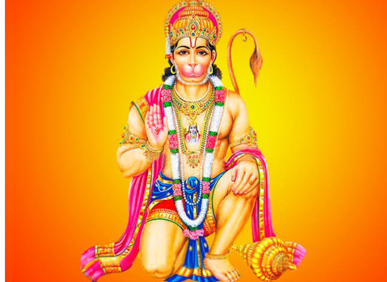
గర్భముదాల్చి శివాశ సంభూతుడైన "శ్రీ ఆంజనేయస్వామి" కి జన్మ ఇచ్చింది. మనోజవం మూతతుల్య వేగం జితేంద్రియంబుద్ధిమతాంవరిష్టం, వాతాత్మజం వానరయూధ ముఖ్యం

-నేడు హనుమాన్ జన్మోత్సవం -అందరికీ హనుమాన్ జన్మోత్సవ శుభాకాంక్షలు