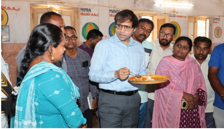
భద్రాద్రి కొత్తగూడెం, ఏప్రిల్ 1 (నేషనలిస్ట్ వాయిస్):

-పాఠశాలలో సిబ్బంది తీరుపై కలెక్టర్ అంకిత్ ఆగ్రహం