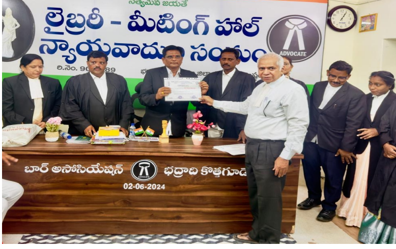
భద్రాద్రి కొత్తగూడెం, ఏప్రిల్ 1 (నేషనలిస్ట్ వాయిస్):