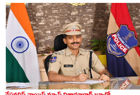
నేషనలిస్ట్ వాయిస్ న్యూస్ నిజామాబాద్ బ్యూరో

నిజామాబాద్ కమిషనరేటు పరిధిలోని నిజామాబాద్, ఆర్కూర్, బోధన్ డివిజన్ పరిధి లోని ఈ నెల 02 న హనుమాన్