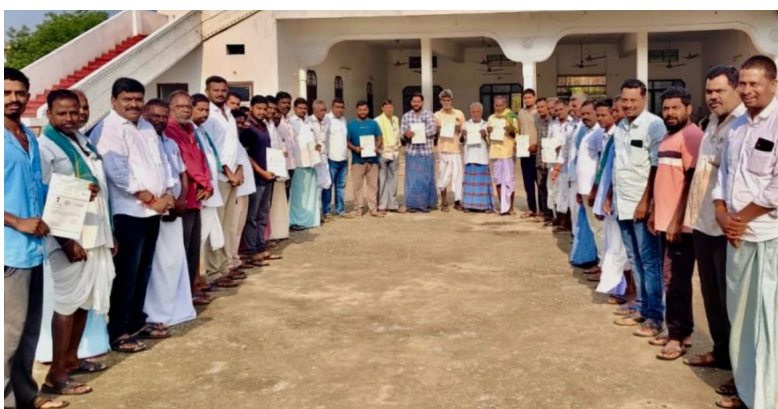
మార్చి 31 నేషనలిస్ట్ వాయిస్

-11 మందికి రూ.3.42 లక్షల అందజేత -తడపాకల్ లో మరో ఇద్దరికి చెక్కులు