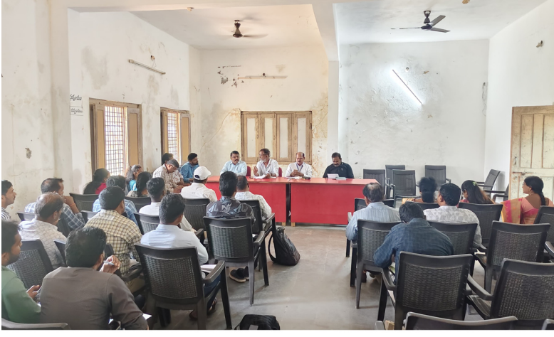
vivo V60 | 23mm 1/1.88 1/33s ISO499 03/31/2026, 11:47