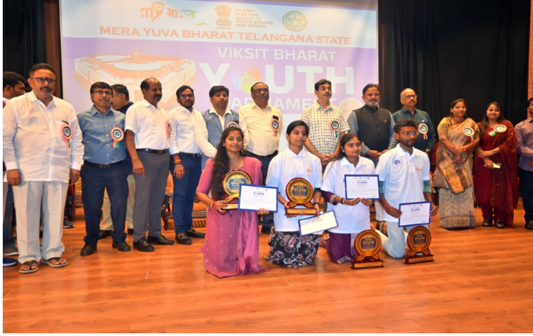
హైదరాబాద్, మార్చి 31. నేషనలిస్ట్ వాయిస్ ప్రతినిధి: