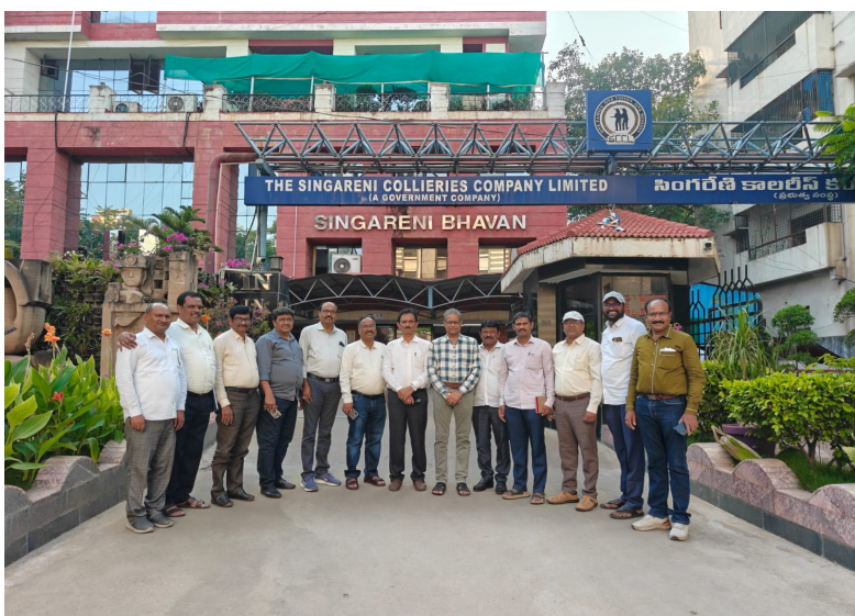
డైరెక్టర్ లకు మరియు జిఎం సి డి ఎస్ మరియు కృతజ్ఞతలు తెలియజేశారు. .... కు హృదయపూర్వక ధన్యవాదములు