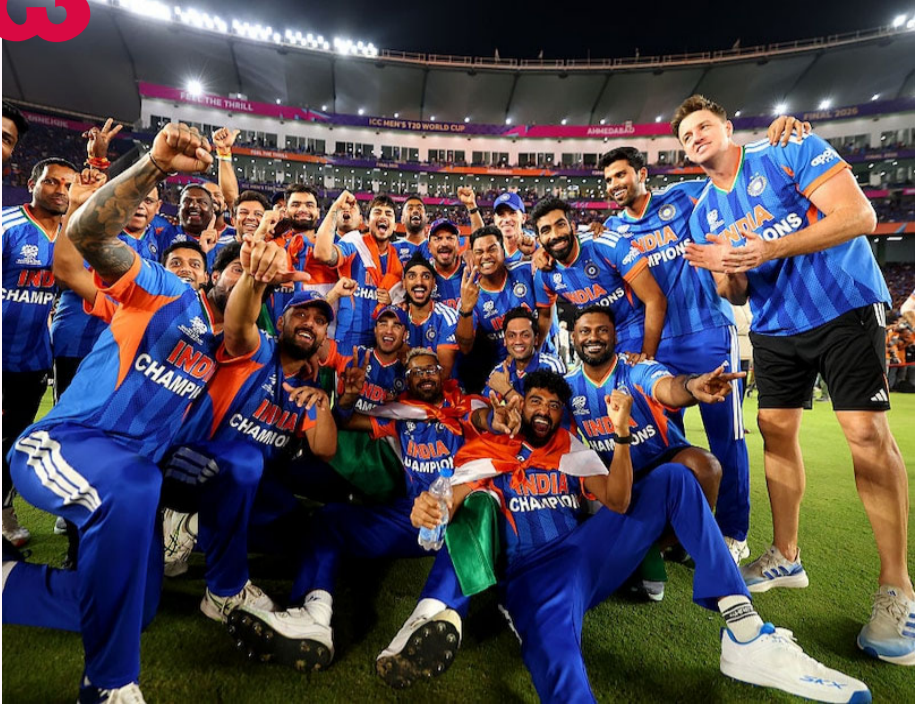
చేయడానికి సిద్ధంగా ఉందని చెప్పవచ్చు. ఇక 2027లో వరల్డ్ కప్ కూడా అందుకోవాలని ఫ్యాన్స్ కోరుకుంటున్నారు. మరి ఆ టోర్నీకి టీమ్ ఇండియా ఎలా సిద్ధమవుతుందో చూడాలి.