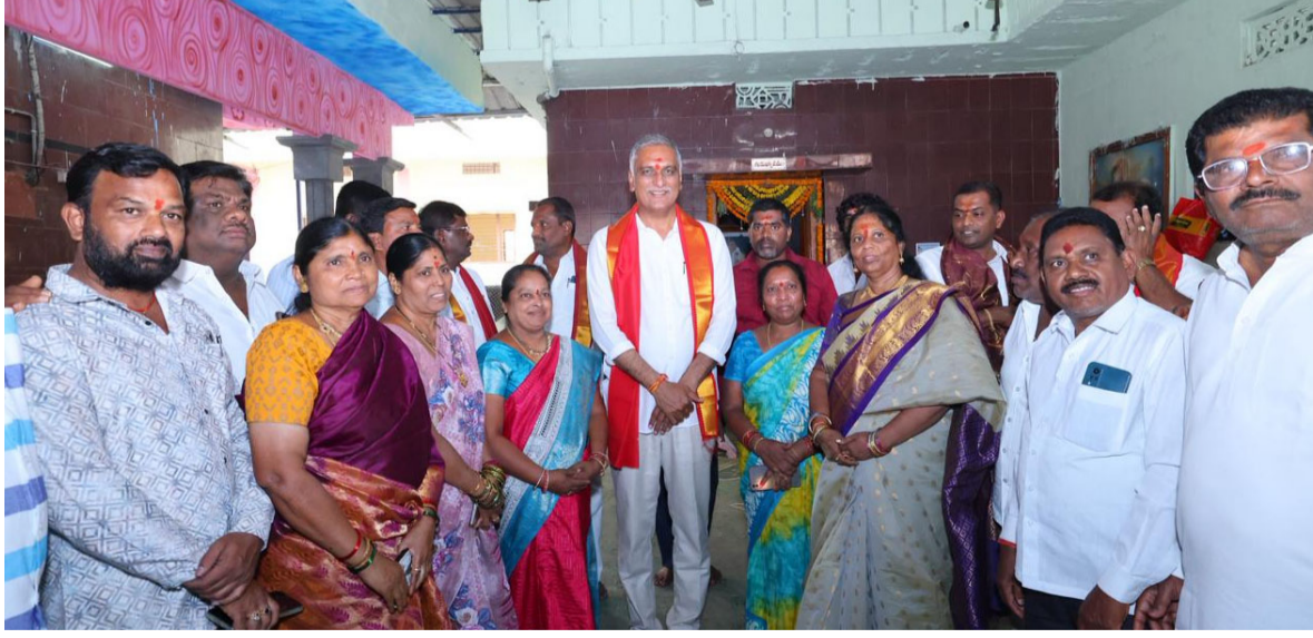
సిద్దిపేట జిల్లా ప్రతినిధి, మార్చి 09.