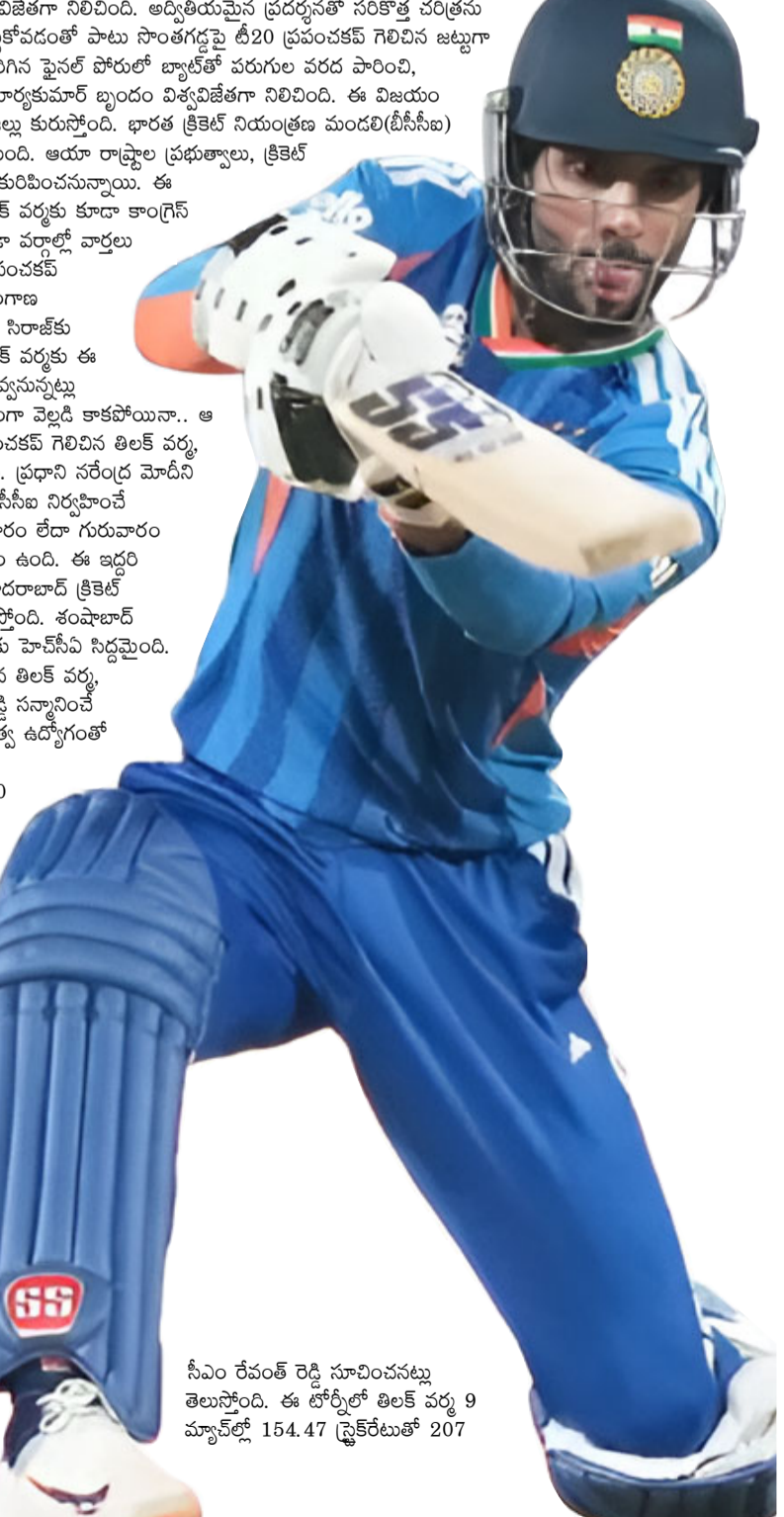
సీఎం రేవంత్ రెడ్డి సూచించినట్లు తెలుస్తోంది. ఈ టోర్నీలో తిలక్ వర్ష 9 మ్యాచ్ లో 154.47 స్ట్రైక్ రేట్ తో 207 పరుగులు చేశాడు. చివరలో బ్యాటింగ్ కు వచ్చి విలువైన పరుగులు అందించాడు.