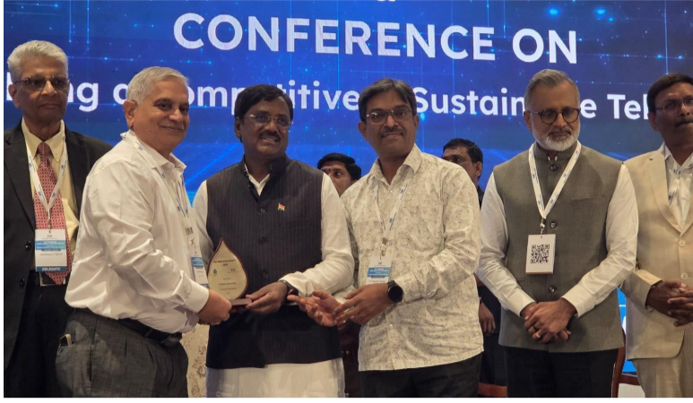
పలు విభాగాల అధిపతులు తదితరులు విశ్వవిద్యాలయం యొక్క నిరంతర ప్రతిష్టాత్మక వన మహోత్సవ అవార్డును అందుకున్నందుకు హర్షం వెలిబుచ్చారు. పర్యావరణ బాధ్యత, స్థిరమైన అభివృద్ధికి అభివృద్ధిని వారు అభివృద్ధించారు.