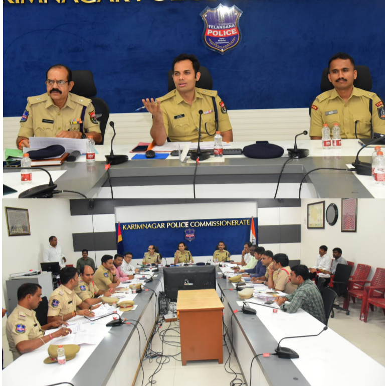
అనుమానాస్పద లావాదేవీలు జరిగితే వెంటనే పోలీసులకు సమాచారం అందించండి. బ్యాంకు అధికారుల సమన్వయంతో మ్యూల్ ఖాతాదారుల పూర్తి వివరాలు సేకరిస్తున్నామని, విచారణ వేగవంతం చేసి మిగిలిన నేరస్థులను కూడా త్వరలోనే పట్టుకుంటామని గురువారం కమిషనరేట్ కేంద్రంలోని కాన్ఫరెన్స్ హాలునందు జరిపిన సమీక్షా సమావేశంలో సీపీ స్పష్టం చేశారు.

అవరిచితులకు మీ బ్యాంకు ఖాతా, ఏటీఎం కార్డు, లేదా ఓటిపి (గ్లా) వివరాలు ఎట్టిపరిస్థితుల్లోనూ ఇవ్వకండి. నెలవారీ కమిషన్లు ఇస్తామంటూ మీ ఖాతాను వినియోగించుకుంటామని వచ్చే వ్యక్తుల పట్ల అప్రమత్తంగా ఉండండి. మీ ఖాతాలో