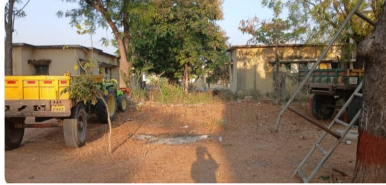
భవిష్యత్ తరాలకు ప్రమాదకర పరిస్థితులు ఏర్పడే అవకాశముందని అందువల్ల ప్రజలు చట్టాలను గౌరవిస్తూ ఇసుక అక్రమ తవ్వకం, రవాణా వంటి అక్రమ కార్యకలాపాలకు దూరంగా ఉండాలని సూచించారు. జిల్లాలో ఎక్కడైనా అక్రమ ఇసుక తవ్వకం లేదా రవాణా జరుగుతున్నట్లు గమనిస్తే వెంటనే సమీప పోలీస్ స్టేషన్ కు సమాచారం అందించాలని, చట్ట అమలులో ప్రజలు పోలీసులకు సహకరించాలని ఎస్పీ కోరారు. ప్రజల సహకారంతోనే అక్రమ ఇసుక రవాణాను పూర్తిగా అరికట్టగలమని ఆమె పేర్కొన్నారు.