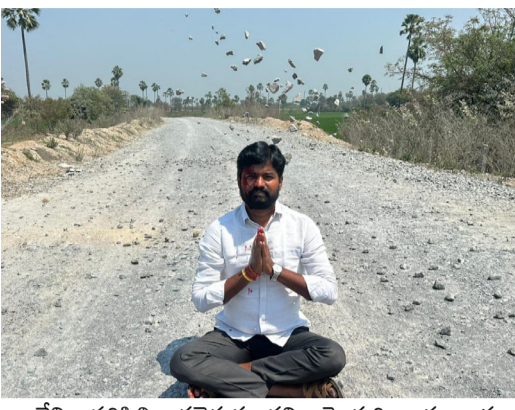
రాజీని పరిస్థితి తలెత్తుతుందని హెచ్చరించారు. ఈ రహదారి కేవలం అపొకర్తం కాదు ఇది ప్రాణహాని అని, ప్రతి రోజూ ప్రమాదాల అంచున ప్రజలు జీవిస్తున్నారని ఆవేదన వ్యక్తం చేశారు. ఇక్కడి ప్రజల ప్రాణాలు కూడా విలువైనవేనన్నారు. ఇప్పటికైనా రాష్ట్ర ప్రభుత్వం ఈ విషయంలో వెంటనే స్పందించి గుండ్లపల్లి పొత్తూరు డబుల్ రోడ్డు నిర్మాణ పనులను త్వరితగతిన పూర్తి చేయడానికి చర్యలు తీసుకోవాలని ఆయన ఈ సందర్భంగా డిమాండ్ చేశారు.

నడిరోడ్డులో కూర్చుని నిరసన వ్యక్తం చేస్తూ మాట్లాడారు. గుండ్లపల్లి పొత్తూరు రహదారి డబుల్ రోడ్డు నిర్మాణం పట్ల కాంగ్రెస్ రేవంత్ రెడ్డి ప్రభుత్వ నిర్లక్ష్యాన్ని తీవ్రంగా ఎండగట్టారు. గుండ్లపల్లి నుండి పొత్తూరు వరకు ఉన్న ఈ డబుల్ రోడ్డు కోసం దశాబ్దాలుగా ప్రజలు వేచి చూస్తున్నారని తెలిపారు. ప్రతి ఎన్నికల సమయంలో హామీలుగా ప్రతి ప్రభుత్వంలో శంకుస్థాపనలు చేసి చేతులు దులుపుకుంటే, ఇక్కడి ప్రజలకు మాత్రం గాయాలు, ప్రమాదాలే మిగిలాయని ఆగ్రహం వ్యక్తం చేశారు. గతంలో బి ఆర్ ఎస్ ప్రభుత్వం 71 కోట్ల రూపాయల జి.ఓ. తీసుకొచ్చి శంకుస్థాపన చేసి ప్రచారంతో సరిపెట్టుకుందని విమర్శించారు. ఇప్పుడు అధికారంలో ఉన్న కాంగ్రెస్ పార్టీ ఎమ్మెల్యే "100 రోజుల్లో రోడ్డు నిర్మిస్తా" అని హామీ ఇచ్చి, ఉన్న రహదారినే చెదగొట్టి కంకర పోసి ప్రజల ప్రాణాలతో చెలాటామాడుతున్నారని ఆరోపించారు. నిత్యం ఆ కంకర రాళ్లు ఎగిరిపడి చిన్నారులు, వృద్ధులు గాయపడుతున్నారని. తన మొఖంపై ఉన్న హోలీ రంగులా ప్రజల ముఖాలపై రక్తపు మచ్చలు పడుతున్నారన్నారు. ఓట్లీసిన పాపానికి ప్రజలు రక్తం కళ్ళతో చూడాలా? అంటూ సీఎం రేవంత్ రెడ్డిని నిలదీశారు. వర్షాకాలం వస్తే మండలం మొత్తం జలదిగ్భంధనానికి గురవుతుందని, అంబులెస్స్ కూడా