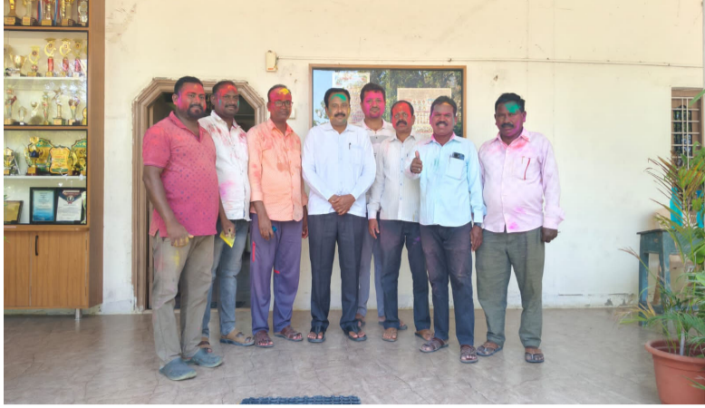
మార్చి 3 మన నేషనలిస్ట్ వాయిస్ నిజామాబాద్ జిల్లా సిరికొండ మండలంలో హోలీ పండుగ సందర్భంగా మంగళవారం గ్రామాలను రంగుల మేళవింపుగా మార్చింది. ఉదయం నుంచే యువత, చిన్నారులు రంగులతో వీధుల్లోకి వచ్చి