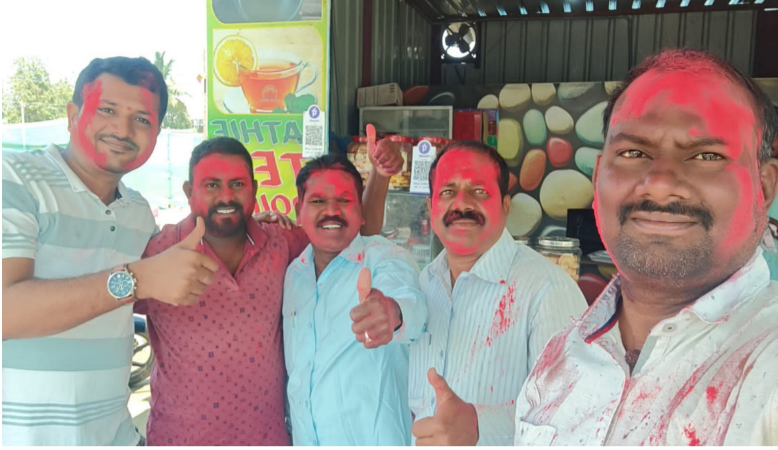
గీతాలతో వాతావరణం మరింత ఉత్సాహంగా మారింది. మహిళలు, యువకులు, వృద్ధులు సమానంగా పాల్గొని పండుగ ఆనందాన్ని పంచుకున్నారు. హోలీ సందర్భంగా ఎలాంటి అవాంఛనీయ సంఘటనలు చోటుచేసుకోకుండా పోలీసులు ముందస్తు చర్యలు తీసుకుని గ్రామాల్లో బంద్ బస్సు నిర్వహించారు. కాంతి, సామరస్య వాతావరణంలో వేడుకలు సాఫీగా ముగిశాయి. మొత్తంగా సిరికొండ మండలంలో హోలీ పండుగ ఆనందానికి, ఐక్యతకు ప్రతీకగా జరుపుకున్నారు.