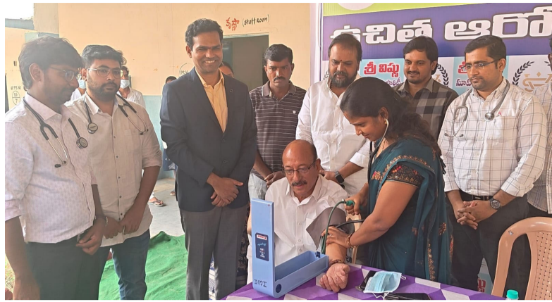
నిజామాబాద్ రూరల్ సిరికొండ