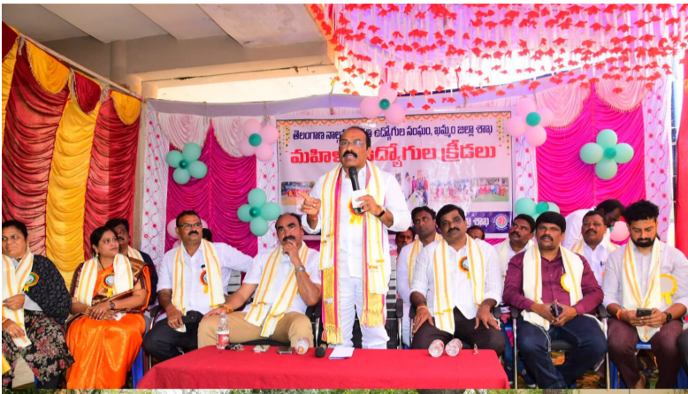
ఖమ్మం బ్యూరో మన నేషనలిస్ట్ వాయిస్ మార్చి 1.