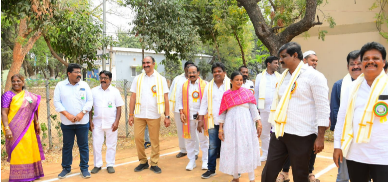
తెలంగాణ నాలుగో తరగతి ఉద్యోగుల ఖమ్మం జిల్లా కమిటీ మహిళా దినోత్సవ సందర్భంగా