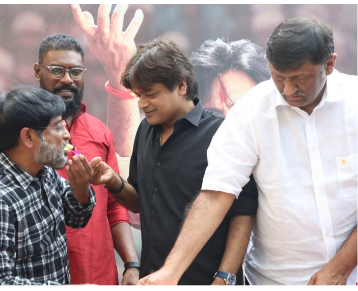
ఉస్మాద్ భగత్ సింగ్ సినీమా బాగుందన్న అభిప్రాయం రావడం ఎంతో ఆనందాన్నిచ్చిందని దర్శకుడు