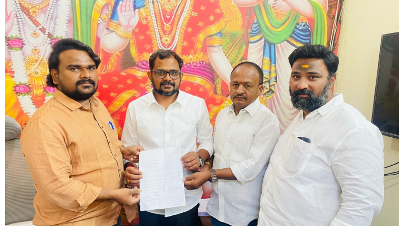
సంబంధిత ఎంకెఓ, డి కె ఓ అధికారులు వెంటనే ఈ అక్రమ భవనంలో నెలకొన్న "ఇంటర్నేషనల్ డిజైన్ పబ్లిక్ స్కూల్" పై చర్యలు తీసుకొని, విద్యార్థుల భవిష్యత్తును కాపాడాలని కోస్టిలర్లు డిమాండ్ చేశారు. స్థానికులు, తల్లిదండ్రులు కూడా ఈ అంశంపై తీవ్ర ఆందోళనతో ఉన్నారు.