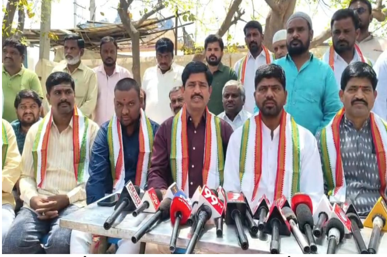
వారిని కూడా పోలీసులు రిమాండ్కు పంపారని ఆగ్రహం వ్యక్తం చేశారు. దళితులపై దాడి జరిగినా పోలీసులు కనీసం కేసు నమోదు చేయలేదని ఆరోపించారు.

తుమ్మలపల్లిలో ఒక ఇసుక వ్యాపారి వల్ల జరిగిన గొడవను పెద్దది చేసి, సంబంధం లేని