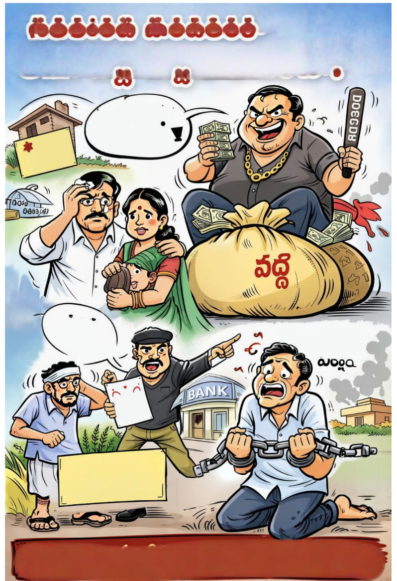
వ్యక్తం చేస్తున్నారు. అధికారులు తక్షణమే స్పందించి అక్రమ వడ్డీ వ్యాపారులను అరికట్టాలని స్థానిక ప్రజలు అంటున్నారు.

నిజామాబాద్ జిల్లా సిరికొండ మండలంలో వడ్డీ వ్యాపారుల దందా రోజురోజుకు విస్తరిస్తూ ప్రజలను ఆర్థికంగా కుదేలు చేస్తోంది. అత్యవసర అవసరాల కోసం అప్పు తీసుకున్న పేద, మధ్యతరగతి కుటుంబాలు అధిక వడ్డీల భారంతో తీవ్ర ఇబ్బందులు పడుతున్నాయి. నెలకు 5 నుండి 10 శాతం వరకు వడ్డీ వసూలు చేస్తున్నారని బాధితులు అంటున్నారు. అప్పు తీర్చలేకపోతే వడ్డీ మీద వడ్డీ వేస్తూ అప్పుదారులను మరింత కష్టాల్లోకి నెట్టేస్తున్నారని ఆరోపిస్తున్నారు. మండలంలో అత్యవసర వైద్యం, పిల్లల చదువు, వ్యవసాయ ఖర్చులు వంటి అవసరాల కోసం చాలా మంది బ్యాంకులను ఆశ్రయించినా, సరైన సమయంలో రుణాలు అందకపోవడంతో చివరికి వడ్డీ వ్యాపారులను ఆశ్రయించాల్సిన పరిస్థితి ఏర్పడుతోంది. ఈ పరిస్థితిని కొంతమంది వడ్డీ వ్యాపారులు దుర్వినియోగం చేస్తూ అధిక వడ్డీలతో డబ్బులు ఇస్తున్నారని స్థానికులు అంటున్నారు. అప్పు తీసుకున్న వారికి తిరిగి చెల్లించడంలో ఆలస్యం అయితే ఒత్తిడి పెంచడం, ఇంటి వద్దకు వెళ్లి డబ్బులు డిమాండ్ చేయడం, కొన్నిసార్లు అవమానకరంగా ప్రవర్తించడం జరుగుతోందని బాధితులు ఆవేదన వ్యక్తం చేస్తున్నారు. ఈ కారణంగా కొందరు కుటుంబాలు ఆర్థికంగా తీవ్రంగా దెబ్బతింటున్నాయని మండలంలో వడ్డీ వ్యాపారం నియంత్రితం లేకుండా సాగుతుండటంపై ప్రజలు ఆందోళన