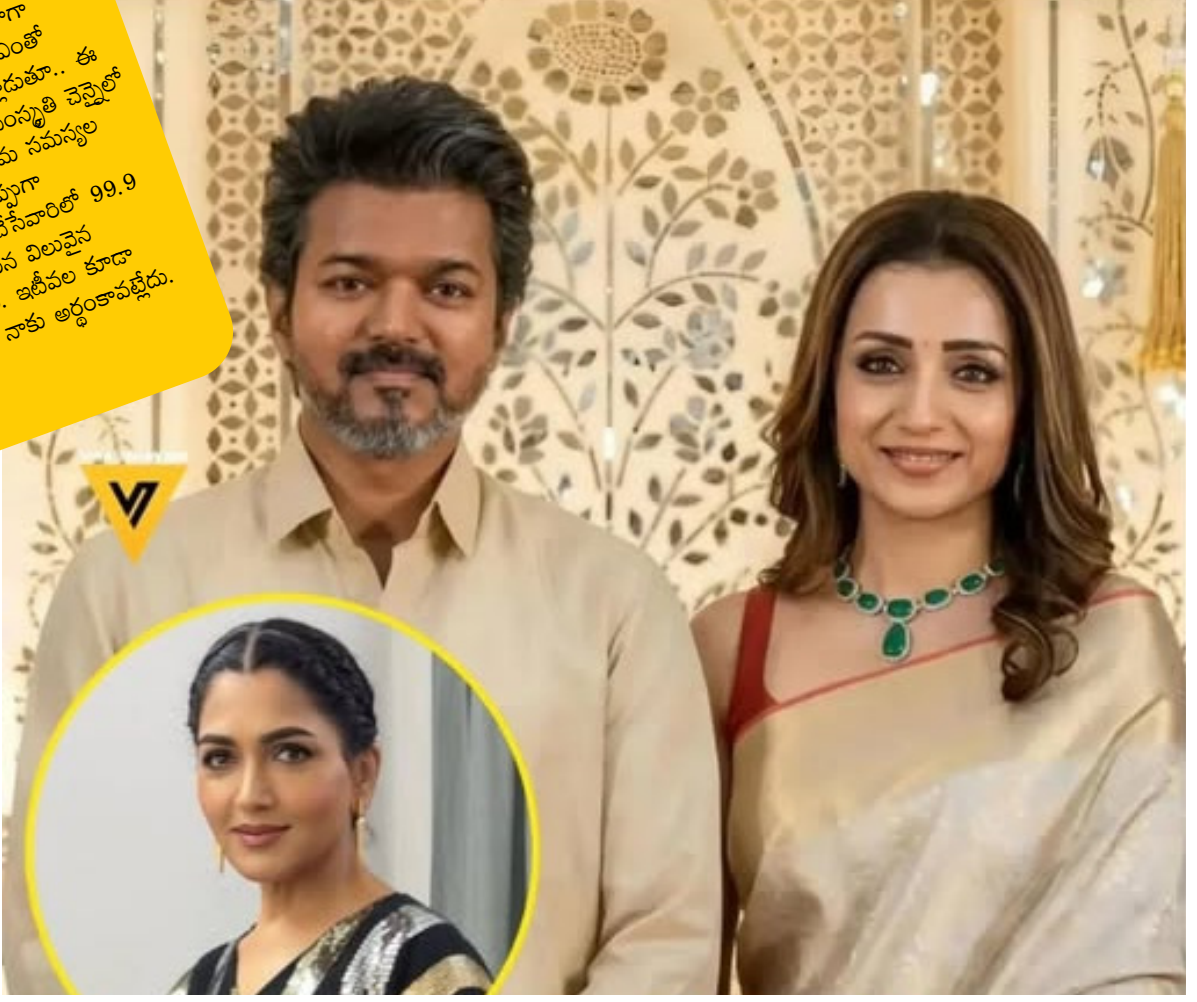
ప్రస్తుతానికైతే.. పవన్ కల్యాణ్ నటించిన 'ఉస్మాద్ భగత్ సింగ్' చిత్రం విడుదలకు సిద్ధంగా ఉంది.