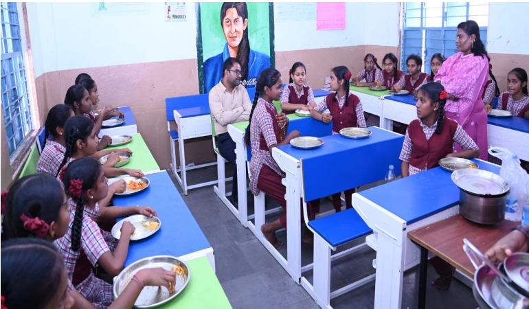
పెద్దపల్లి జిల్లా, మార్చి 10 (నేషనలిస్ట్ వాయిస్ ప్రతినిధి):