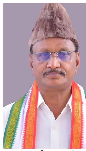
విజయాన్ని సాధించినవారు. ఈ విజయం ద్వారా తెలంగాణ ప్రజలు బీఆర్ఎస్ మరియు బీజేపీ పార్టీలు కాంగ్రెస్