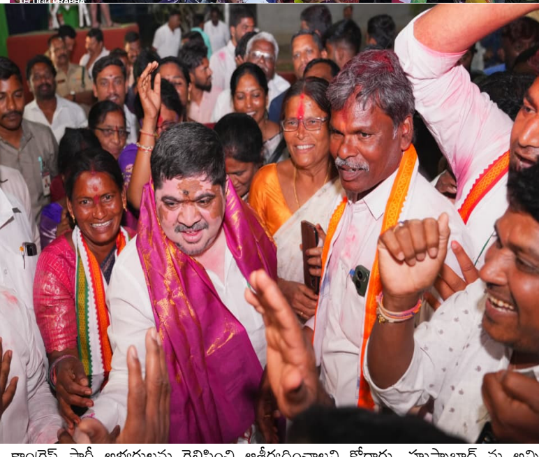
కాంగ్రెస్ పార్టీ అభ్యర్థులను గెలిపించి ఆశీర్వదించాలని కోరారు. హుస్సాబాద్ ను అన్ని రంగాల్లో అభివృద్ధి కొనసాగిస్తానని ప్రచారం కొనసాగించారు. అదేవిధంగా ప్రజల మద్దతుతో 20 వార్డుల్లో 16 సీట్లు కాంగ్రెస్ పార్టీకి అవకాశం ఇచ్చారు.