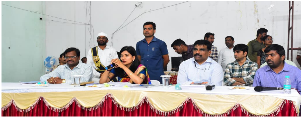
నేషనలిస్ట్ వాయిస్ న్యూస్ మున్సిపాలిటీ