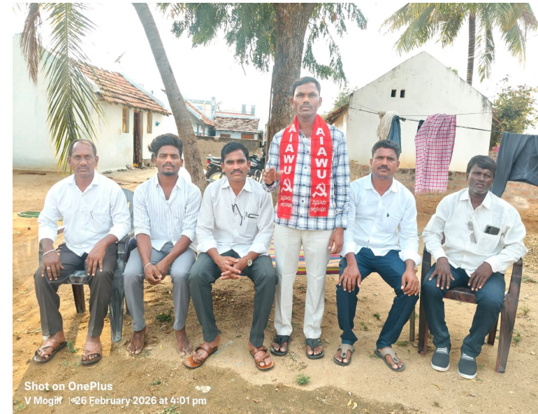
Shot on OnePlus V Mogi# 46 February 2026 at 4:01 pm