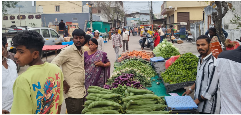
కుత్బుల్లాపూర్, ఫిబ్రవరి 23(నేషనలిస్ట్ వాయిస్):

గాజులూరూపం సర్కిల్ మహాదేవపురం డివిజన్ దేవేందర్ నగర్ లో సోమవారం, శుక్రవారం రోజులలో జరుగుతున్న వారాంతపు సంత వల్ల సాయంత్రం వేళలో దేవేందర్ నగర్ చౌరస్తా నుండి రావినాయకులరెడ్డి నగర్ చౌరస్తా వరకు ట్రాఫిక్ జామ్ సమస్య ఏర్పడుతుంది. దీంతో అటువైపుగా రాకపోకలు సాగించే వాహనదారులు ప్రయాణికులు తీవ్ర ఇబ్బందులకు గురవుతున్నారు. ఈ సమస్యను గుర్తించిన దేవేందర్ నగర్ జేపీసీ నాయకులు సోమవారం మధ్యాహ్నం మూడు గంటల నుండి సంతకు విచ్చేస్తున్న వ్యాపారులకు జేపీసీ నాయకులు నచ్చజెప్పూ రోడ్డుకు ఇరువైపులా ఎలాంటి సంత