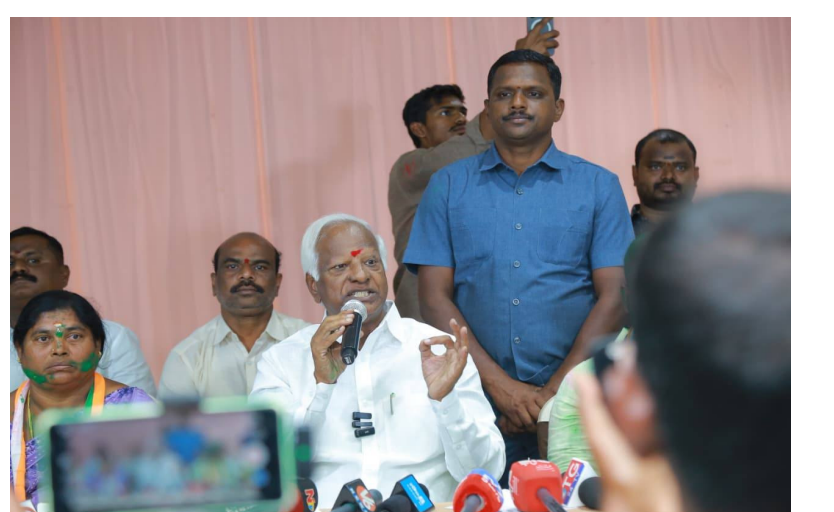
ప్రవచనంలో ఏమాత్రం మార్పు రాలేదని కడియం దుయ్యబట్టారు. వారి అహంకారం, అహంభావం వల్లే ప్రజలు వారికి దూరమయ్యారని, ఇప్పటికైనా చౌకబారు రాజకీయాలు మానుకోవాలని హితవు పలికారు. తెలంగాణ ఉద్యమంలో

సమావేశాలకు రాకుండా ఎక్కడ ఉన్నారని ఆయన నిలదీశారు. ప్రజా సమస్యలపై ప్రభుత్వాన్ని అసెంబ్లీలో ఎందుకు నిలదీయడం లేదో సమాధానం చెప్పాలని డిమాండ్ చేశారు. కేవలం సెంటిమెంట్ ను వాడుకుని రాజకీయాలు చేయడం తప్ప, క్షేత్రస్థాయిలో ప్రజల మధ్యకు వచ్చి వారి కష్టాలను తీర్చే ఉద్దేశం కెసిఆర్ కు లేదని ఎద్దేవా చేశారు. గత పదేళ్ల బీఆర్ఎస్ పాలనలో కల్లుకుంట్ల కుటుంబం చేసిన అవినీతి, అక్రమాలతో ప్రజలు విసిగిపోయారని కడియం ఆరోపించారు. అందుకే ప్రజలు ఆ పార్టీని తిరస్కరించి, ఓటు వేయడానికి ఇష్టపడలేదని స్పష్టం చేశారు. కాశీశ్వరం లాంటి ప్రాజెక్టులను కూలిపోయేలా నిర్మించడమే కాకుండా, రాష్ట్రాన్ని అప్పుల ఊటిలోకి నెట్టి దివాళా తీయించారు. ఎన్నో సామ్రాజ్యం ఇరుక్కున్న నేతను జాతిపిత అని ఎలా పిలుస్తారని ఆయన నిప్పులు చెరిగారు. అధికారం కోల్పోయినప్పటికీ బీఆర్ఎస్ నాయకుల