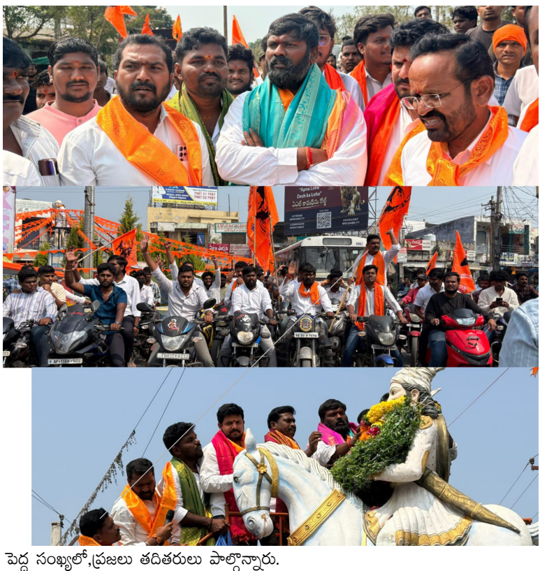
పెద్ద సంఖ్యలో ప్రజలు తదితరులు పాల్గొన్నారు.