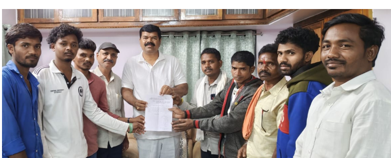
సూపర్వైజర్స్, స్టాఫ్, అంగన్వాడీ డీవర్లు తదితరులు పాల్గొన్నారు.