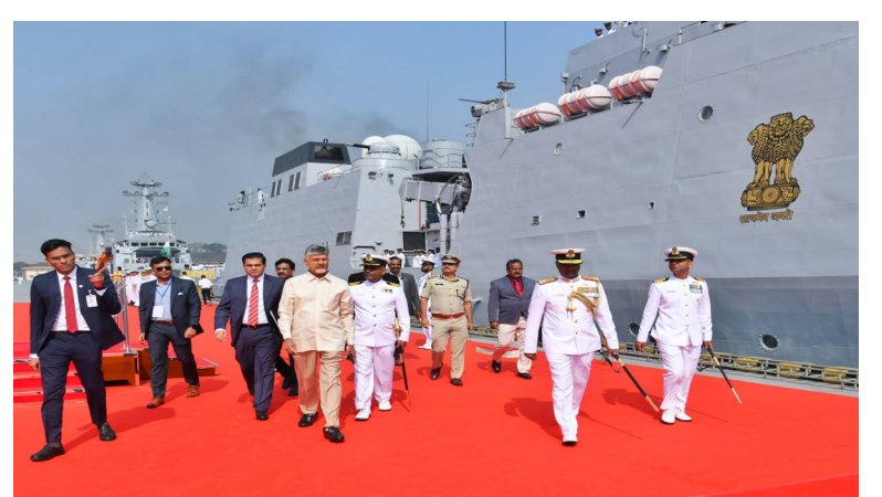
యాపిఐ.. తదితర దేశాల నుంచి వచ్చిన 19 విదేశీ నౌకలు, భారత నేపీడి చెందిన 45 నౌకలు, కోస్టగార్డ్, మర్చంట్ నేపీ, పరిశోధనా నౌకలు 7 ఫ్లీట్ రివ్యూలో పాల్గొన్నాయి.

దేశ తీర ప్రాంత ప్రయాణాలు కాపాడటంలో నేపీడి కీలకపాత్ర అని భారత రాష్ట్రపతి ద్రౌపది ముర్ము తెలిపారు. నమూద్ర వాణిజ్యంలో సైతం నేపీ సుస్థిరత తీసుకొచ్చిందని పేర్కొన్నారు. విశాఖపట్నం తీరం వేదికగా జరుగుతున్న ఇంటర్నేషనల్ ఫ్లీట్ రివ్యూ (ఐఎఫ్ఆర్) బుధవారం ప్రారంభమయ్యాయి. బుధవారం ఈ కార్యక్రమంలో రాష్ట్రపతి ద్రౌపది ముర్ము ముఖ్య అతిథిగా పాల్గొన్నారు. ఈ కార్యక్రమంలో రాష్ట్రపతి ముర్ముతోపాటు ఏపీ గవర్నర్ జస్టిస్ అబ్దుల్ నజీర్, సీఎం చంద్రబాబు, డిప్యూటీ సీఎం పవన్ కల్యాణ్ పాల్గొన్నారు. ఐఎన్ఎస్ సుమేధపై ప్రయాణించారు. నేపీ సిబ్బంది నుంచి రాష్ట్రపతి గౌరవ వందనం స్వీకరించారు. వివిధ దేశాల నుంచి వచ్చిన 19 విదేశీ నౌకలు, భారత నేపీడి చెందిన 45 నౌకలు, కోస్టగార్డ్, మర్చంట్ నేపీ, పరిశోధనా నౌకలు 9 ఫ్లీట్ రివ్యూలో పాల్గొన్నారు. ఆరు వరుసల్లో 71 యుద్ధ నౌకలు పరేడ్ నిర్వహించాయి. విశాఖ తీరంలో ఇంటర్నేషనల్ ఫ్లీట్ రివ్యూ కొనసాగుతోంది. ఆరు వరుసల్లో 71 యుద్ధ నౌకలు పరేడ్ నిర్వహించాయి. ఈ కార్యక్రమాన్ని రాష్ట్రపతి ద్రౌపది ముర్ము, ఏపీ గవర్నర్ జస్టిస్ అబ్దుల్ నజీర్, సీఎం చంద్రబాబు, డిప్యూటీ సీఎం పవన్ కల్యాణ్ నేరుగా వీక్షించారు. నేపీ సిబ్బంది నుంచి రాష్ట్రపతి గౌరవ వందనం స్వీకరించారు. అనంతరం ఐఎన్ఎస్ సుమేధ కౌస్టపై రాష్ట్రపతితో పాటు గవర్నర్, సీఎం, డిప్యూటీ సీఎం ప్రయాణించారు. రష్యా, ఆస్ట్రేలియా,