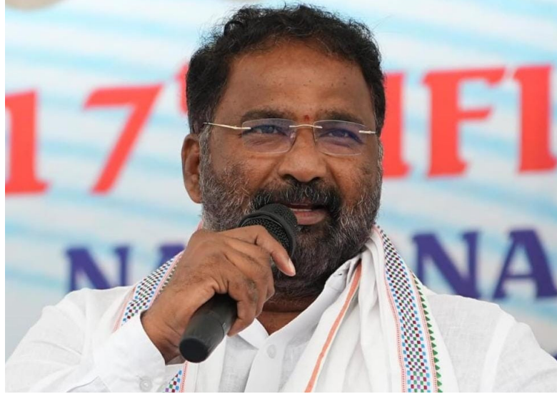
జిల్లా ఉన్నతాధికారులతో సమన్వయం చేసుకుంటూ కబడ్డీ పోటీలను విజయవంతానికి కృషిచేయాలని మంత్రి వాకిటి శ్రీహరి తెలిపారు. ప్రజాప్రతినిధులు కూడా కబడ్డీ పోటీలను సవాల్ గా తీసుకోని అధికారులతో కలిసి ముందుకుపోవాలని మంత్రి చెప్పారు. ఈ టెలికాన్ఫరెన్స్ లో జిల్లా అదనపు కలెక్టర్, జిల్లా ఉన్నతాధికారులు, జిల్లా క్రీడల అధికారి, విద్యుత్, మున్సిపల్ కమిషనర్లు, తహశీల్దార్లు, ఎంపీడిఎస్ అధికారులు, మున్సిపల్ చైర్మన్ వాకిటి మాసన హన్యంతులు పాల్గొన్నారు.