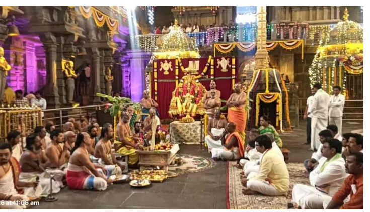
యాదగిరిగుట్ట, ఫిబ్రవరి 18 (నేషనలిస్ట్ వాయిస్):